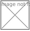
Bild4: Safe Exam Browser mit gestartetem NX CAD Programm auf dem linken Bildschirm ~ auf dem rechten Bildschirm Aufgaben der CAD DemoKlausur

Infos für Aufsichten: Startmodus 1: Nach Login des Prüfungssuser startet Safe Exam Browser in eine hinterlegte Konfiguration und endet am Login für Prüfungsteilnehmende.